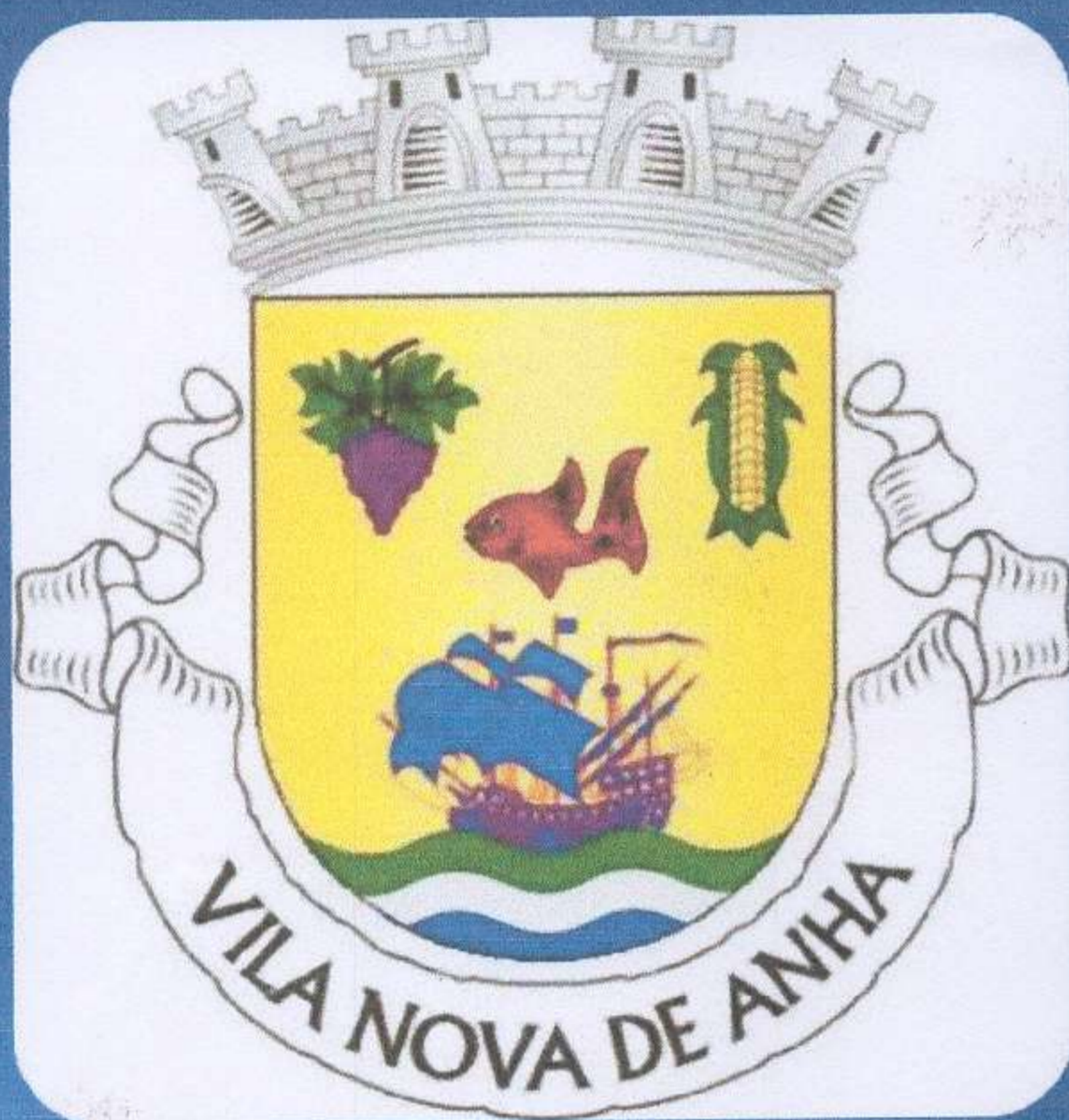
Tabela de Taxas e Licenças 2026